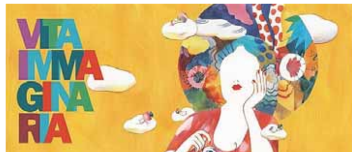
Al Salone del Libro di Torino grande risultato per i tagazzi dell'Ippolito Pindemonte

L'evento, che si è svolto lunedì 13 maggio nella Sala Azzurra del Salone Internazionale del Libro di Torino, ha visto i giovani talenti partire da Pescantina insieme alle loro insegnanti e alla preside dell'Istituto. Con entusiasmo, determinazione e un'irresistibile