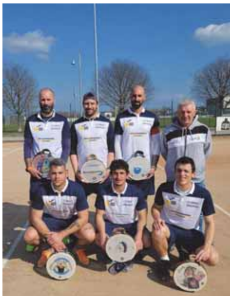
Il team 2024 di Sommacampagna