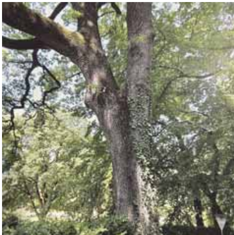
Valeggio sul Mincio, Farnia all'interno del Parco Sigurtà

altro magnifico esemplare: un Perlara di 4,60 metri di circonferenza e classe d'altezza di 20-25. Se invece si prende in considerazione la zona della città e i Comuni più limitrofi, il libro dell'Accademia sottolinea l'importanza del Parco dell'Adige Sud e delle aree verdi, importanti attrattori turistici. Proseguendo poi nel viaggio alla scoperta dei Grandi Alberi, non mancano esempi anche