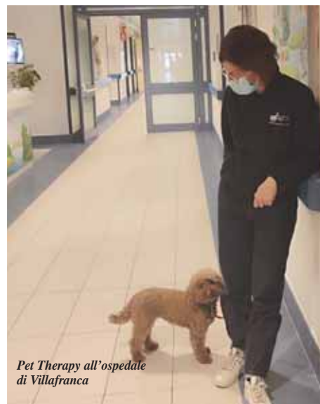
Pet Therapy all'ospedale di Villafranca

serie di progetti come l'Attività Assistita con asini, cani, gatti e conigli. Molto importanti sono i progetti terapeutici con animali, che loro svolgono in collaborazione con gli Enti sanitari del territorio. Infatti, grazie ai cagnolini della Onlus, all'Ospedale di Villafranca, la pet therapy ha fatto ritorno con il progetto "Una coda, un sorriso". Un approccio che continua a dimostrare la sua efficacia nel ridurre lo stress e l'ansia dei piccoli pazienti, in questo specifico caso, ricoverati alla Uoc Pediatria e Patologia Neonatale di Villafranca.