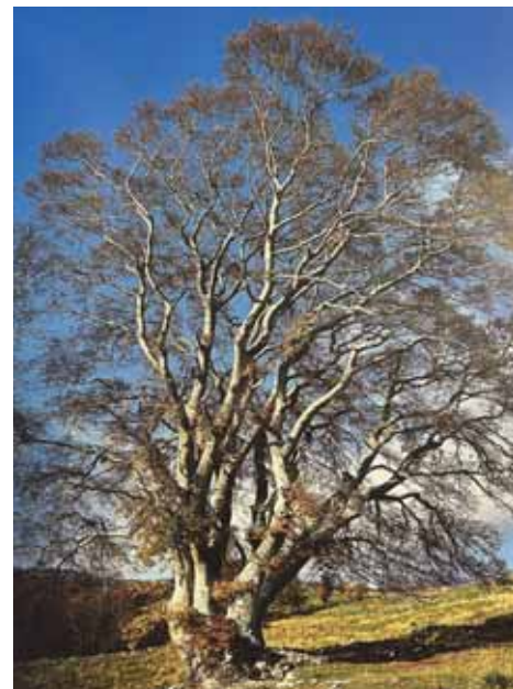
Bosco Chiesanuova, Malga Belfiore di Qua: un faggio classificato Albero monumentale

Alberi veronesi, divisi in sette schede per altrettante aree geografiche. Tra gli esemplari si trova, ad esempio, un imponente esemplare di Faggio a