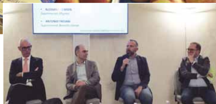
Un momento del convegno sulla pesca Igp di Verona